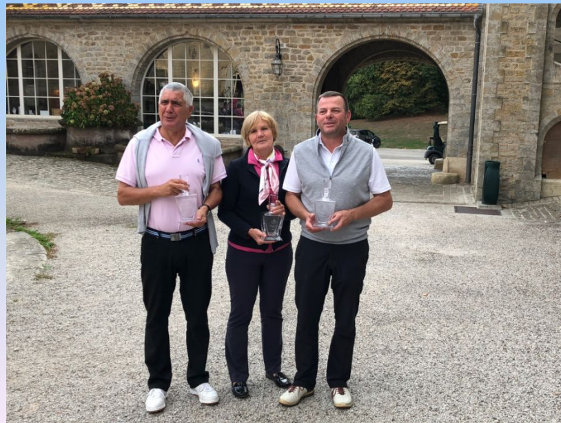
Les champions du club 2018